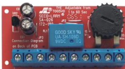
SA-026Q Módulo temporizador miniatura