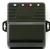
SA-025EQ Temporizador para retard de salida